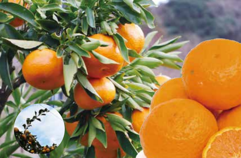
・防鳥ネットで畑を覆います

アメリカで生まれたオレンジみかんです。日本に導入された際には、酸味が強すぎて、商品化されませんでした。5月に入り、ヒヨドリが群がっているのを見て、「もしかすると美味しいのでは？」と食べてみたところ、きつい酸味が抜け、とても食味が優れていたため、経済栽培されるようになりました。美味しさを教えてくれたヒヨドリが畑に入らないようにネットをかけて栽培します。種が多少入りますが、この時期には珍しく、手で皮が剥け、内袋ごと食べられてとても美味しいです。