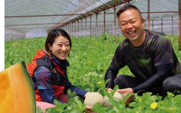
・日本一愛想の良い農家を目指しているそうです