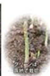
グリーンは日陰で育て

春はフルーツトマトの季節。日本で、トマトの原生地アンデス高原の環境を再現するには、気温も上がり光も強くなり始めた春から初夏が最高です。旬の"緑健"トマトをどうぞ。