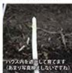
ハウス内を遮光して育てます(あまり写真映えしませんが)