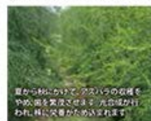
夏から秋にかけて、アスパラの収穫をやめ、畑を荒廃させます。元産地が行われ、林に突き刺さるためです。