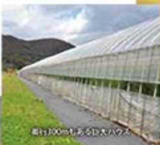
約100mもある巨大ハウス

今は場所を移し、森だった場所を開墾し、巨大な、いや超巨大なビニールハウス群を建てホワイトアスパラと露地ではグリーンアスパラを育てています。