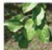
明るい葉の色(「無肥料」)