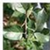
一般的な果樹の葉、濃い緑