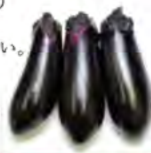
山梨県 6/20~ なす