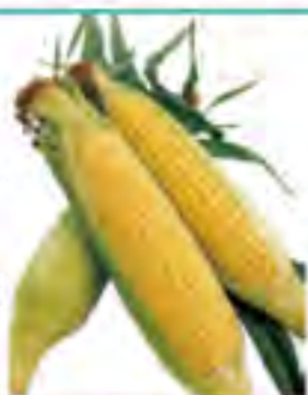
長崎県~6/10頃 とうもろこし

324242-31 486円(税込) 1本 324242-38 3,780円(税込) 8本