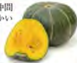
長崎県 /鹿児島県 かぼちゃ 5月下旬~

332542-45 432円(税込) 1カット 332542-31 1,628円(税込) 1玉