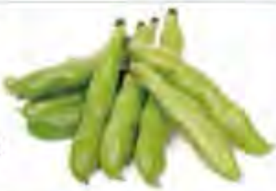
愛媛県他 ソラマメ

321538-14 864円(税込) 約400g 321538-01 1,944円(税込) 約1kg