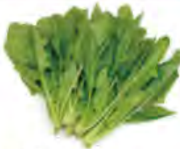
北海道 ほうれん草