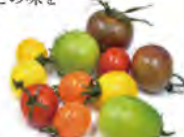
静岡県 カラフルトマト