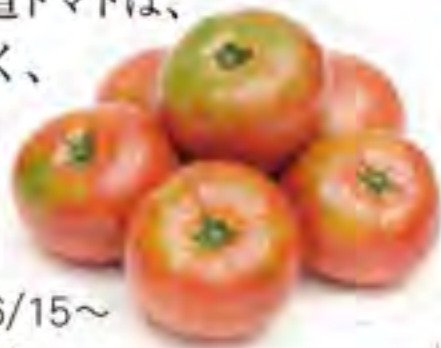
北海道 6/15~ 大玉トマト

3月に種を撒き、じっくりと育った 初期の北海道トマトは、 ずっしりと重く、 美味です。