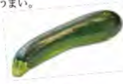
鹿児島県 ズッキーニ