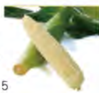
山梨県 ~6/15 ベビーコーン