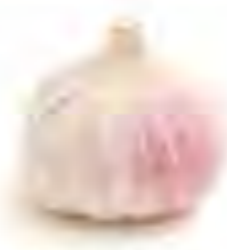
鹿児島県他 にんにく