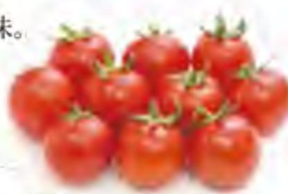
宮崎県/北海道 ミディトマト