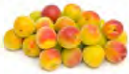
フルーティな香り。