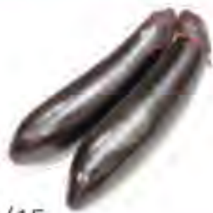
鹿児島県 長なす ~6/15