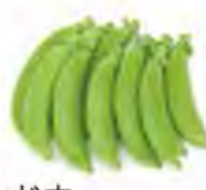
秋田県他 スナップエンドウ