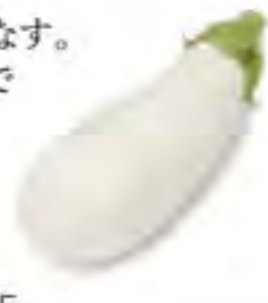
鹿児島県 白なす ~6/15