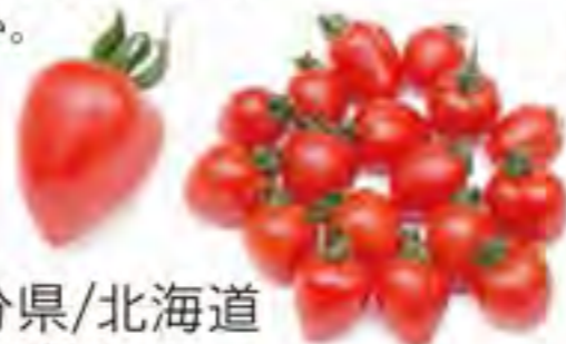
大分県/北海道 いちごトマト

317744-12 702円(税込) 約200g 317744-01 3,240円(税込) 約1kg