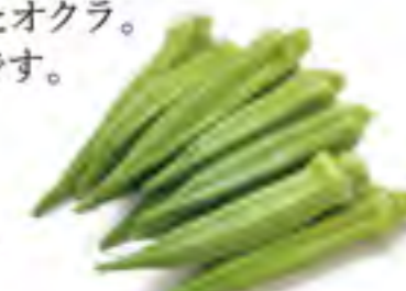
鹿児島県 角オクラ