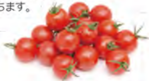
愛知県 ミニトマト