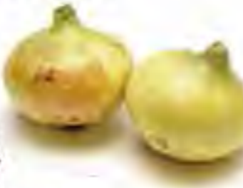
長崎県他 新玉ねぎ