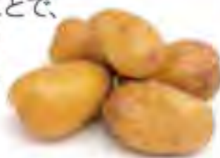
北海道 インカのめざめ

収穫から貯蔵することで、 まるでさつまいもの ような甘さを持った 小じゃがいも品種。