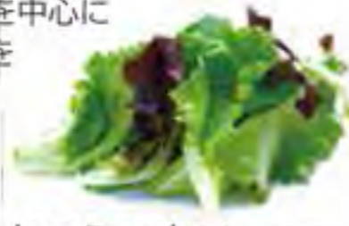
大分県 ベビーレタスマックス