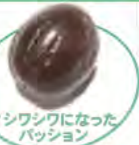
↑シワシワになったパッション