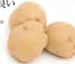
鹿児島県 新じゃが