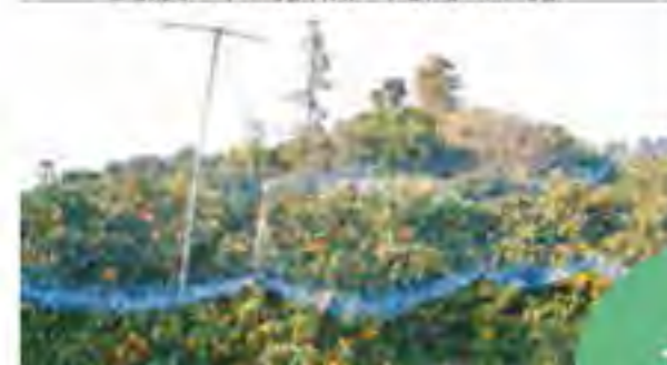
ヒヨドリが食べてしまうので防鳥ネットで畑を覆います。

アメリカで生まれたオレンジみかんです。日本に導入された際には、酸味が強すぎて、商品化されませんでした。