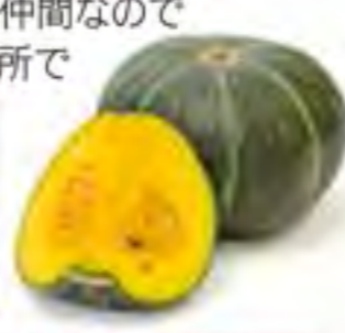
鹿児島県他 かぼちゃ