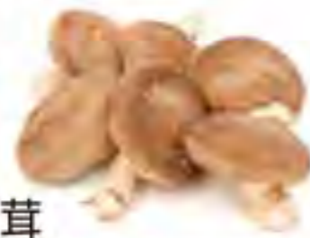
秋田県 原木生椎茸

上流に位置し、生活排水の入らない 場所で育っています。 原木なので 香り、旨み があります。