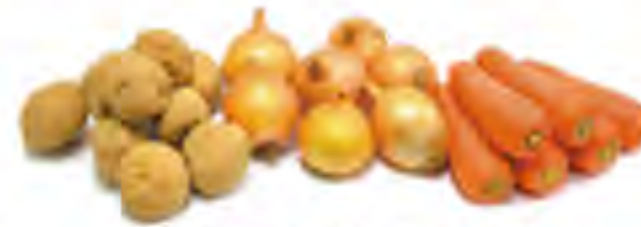
じゃが玉にんじん