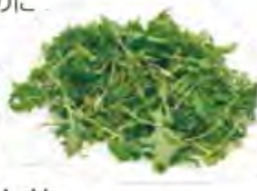
大分県 サラダ水菜