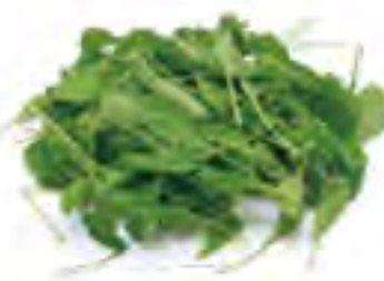
大分県 ルーコラ (カット済み)