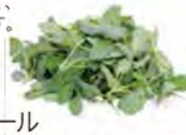
大分県 ベビーケール