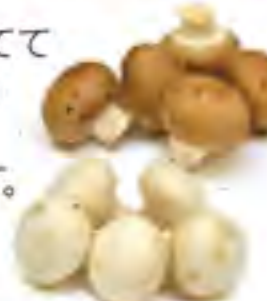
静岡県 マッシュルーム

富士山のふもとで育てて います。生食のできる キノコ。ブラウンの ほうが旨みがあります。