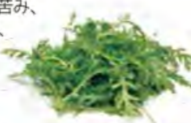
大分県 サラダ春菊