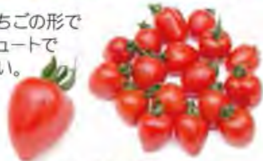
大分県 いちごトマト