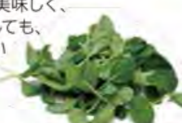
大分県 サラダ小松菜