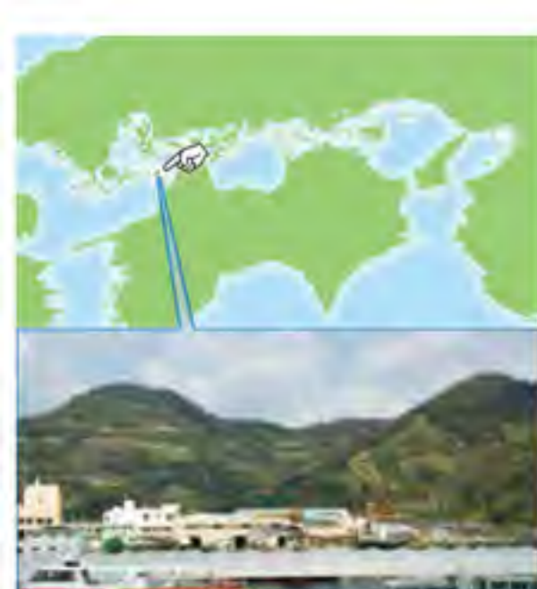
愛媛 中島。瀬戸内海の島。