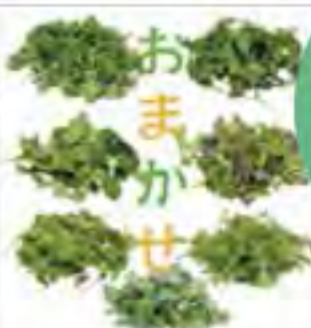
大分県 おまかせリーフ3点セット