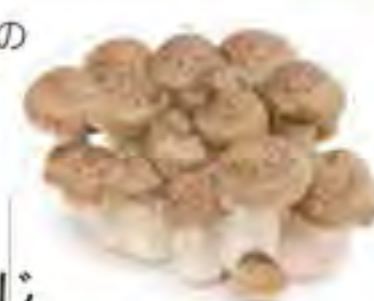
新潟県 ぶなしめじ