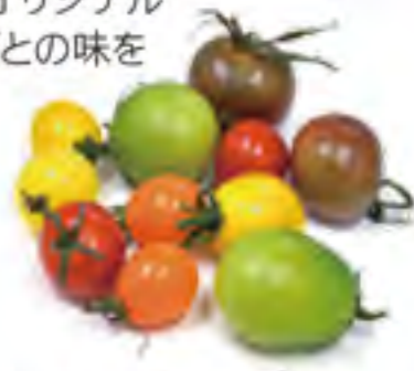
静岡県 カラフルトマト