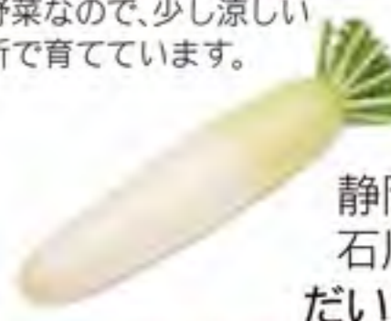
静岡県 石川県 だいこん