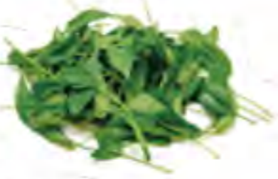
大分県 サラダほうれん草